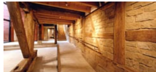
Galerie in Museum